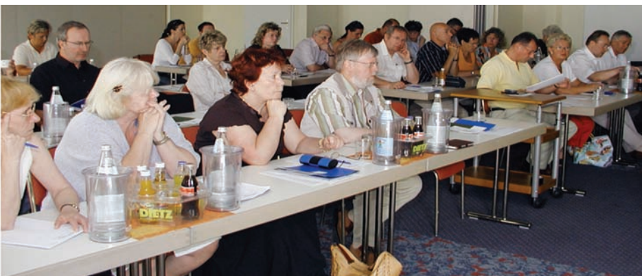
VNZLB-Mitglieder diskutieren das Grundsatzprogramm

Das reine Sachleistungssystem ist überholt und wendet sich immer mehr gegen den Patienten durch Rationierung, Leistungsausgrenzung und Leistungsverweigerung (Budgetproblematik) – siehe „Ärztestreik“. Deshalb ist eine „Online-Rechnungstransparenz“ für den Patienten auch mit erheblichem Bürokratieabbau für den Zahnarzt verbunden und nur durch schrittweise Einführung der Kostenerstattung, wie im Festzuschussystem, zu realisieren.