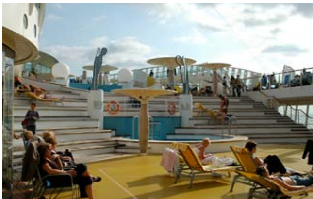
Faulenzen auf der AIDA

Trotz „Fehlstart“ in Warnemünde verbrachten die brandenburger Zahnärzte und ihre Gäste vom 11. bis 21. Juni erlebnisreiche Tage an Bord der AIDA luna. Nachdem die vergangenen Kongressschiffsreisen des Verbandes der Niedergelassenen Zahnärzte des Landes Brandenburg in der Regel in südlichen Gefilden stattfanden, wurden in diesem Jahr die Anrainerstaaten der Ostsee besucht. Von Warnemünde ging es über St. Petersburg, Helsinki, Stockholm, Danzig und Rügen wieder zurück nach Warnemünde. Auf Grund zu starker Winde verzögerte sich dabei die Ausfahrt von Warnemünde um ganze zwei Tage, so dass Tallin nicht angelaufen werden konnte und für St. Petersburg leider auch nur ein einziger Besichtigungstag zur Verfügung stand.