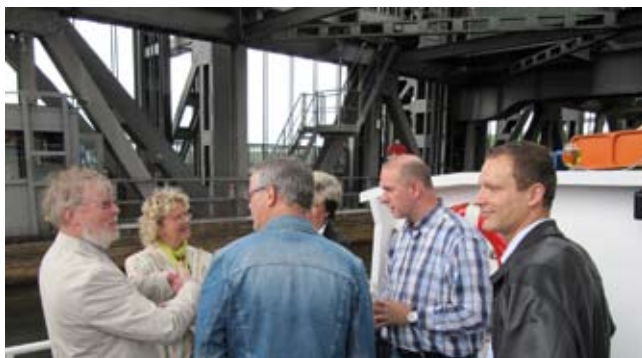
Auf dem Weg nach oben: Mit dem Dampfer im Schiffshebewerk